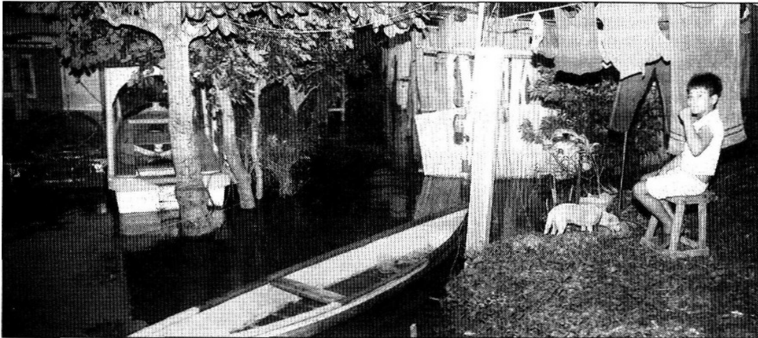
Tlaxcoltalpeños tuvieron que abandonar sus viviendas, mientras que el nivel del río Papaloapan ya rebasó su escala crítica