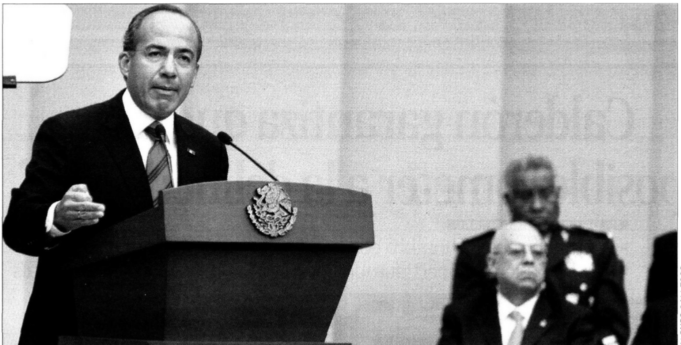
CAMBIO. Con la transición, se logrará la convergencia de los servicios de telefonía, internet y televisión digital, explicó el presidente Felipe Calderón Hinojosa.

Por último, comentó que su gobierno estableció un organismo público que soporte una cadena de televisión pública nacional basada en la ampliación de la cobertura del Canal 11 TV México, a importantes ciudades del país, con lo cual este año duplica su cobertura y alcanza ya a más de 43 millones de mexicanos.