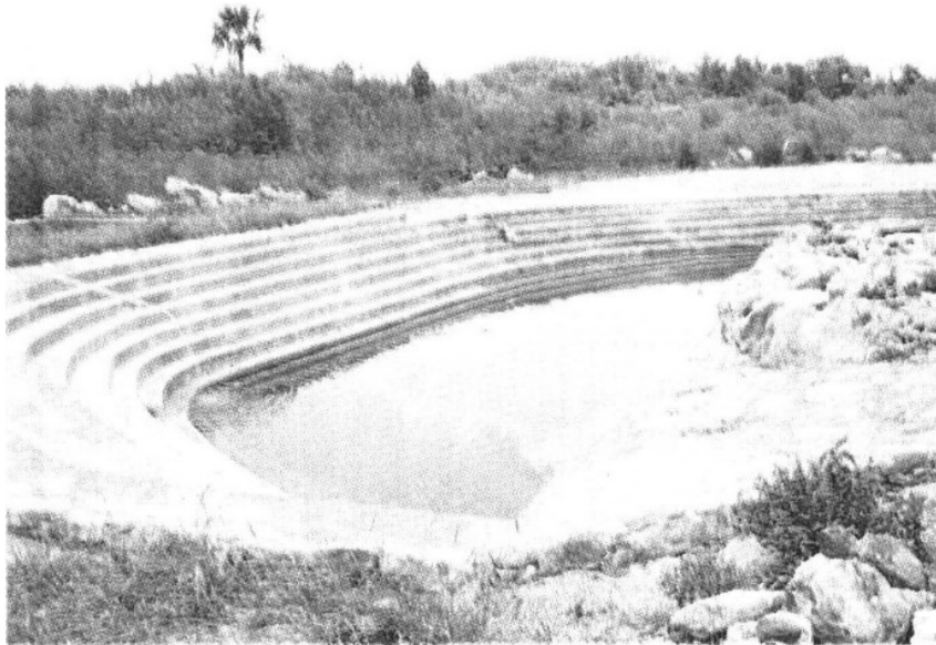
LUJO. En el lugar se construyó una laguna artificial