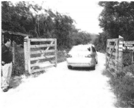
ACCESO. El conjunto habitacional se encuentra cerrado la mayoría del tiempo