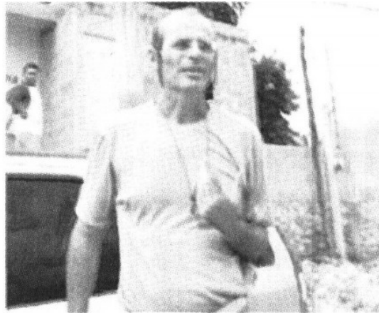
SILENCIO. Uno de los habitantes del lugar, presuntamente italiano, se niega a dar información

Camino a Yaxachén, municipio de Oxkutzcab, se encuentra el grupo de viviendas construidas por europeos al que los habitantes de la zona y reporteros no han tenido acceso. El lugar se encuentra cercado y en constante vigilancia