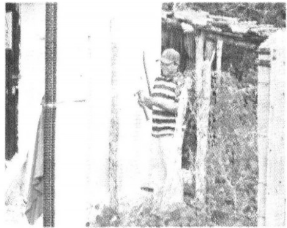
CONSTRUCCIÓN. Vecinosy albañiles aseguran que las casas están hechas de gruesas paredes