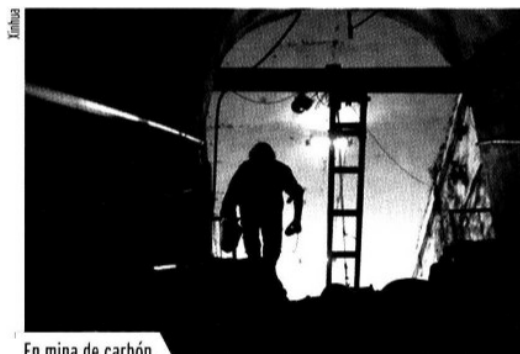
En mina de carbón.

Beijing. Al menos nueve personas murieron y siete permanecen atrapadas en una mina de carbón, luego de que se registró una explosión provocada por el escape de gas en uno de los túneles en Sanyuandong, ciudad de la provincia de Henan, reportó la agencia china de noticias Xinhua. Un total de 127 mineros se encontraban trabajando y 111 de ellos fueron rescatados con vida, dijo un portavoz de la compañía responsable de la mina, Zhengzhou Coal Industry Co.