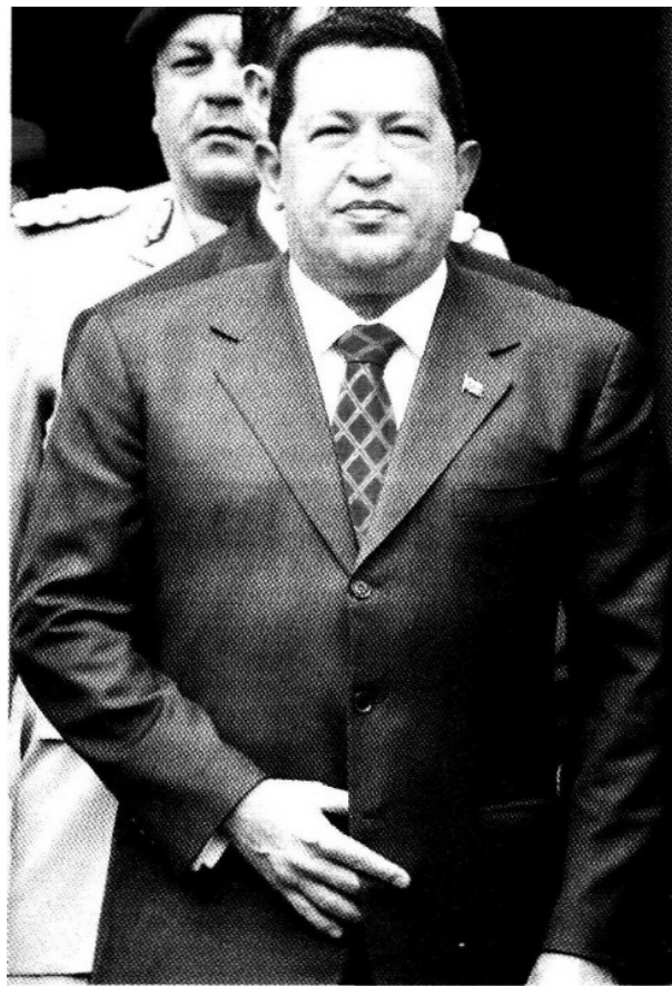
CHÁVEZ estatizó empresas contratistas.

Además de la intervención de 9 bancos y tres televisoras, lo que ha repercutido en el abandono de capital extranjero.