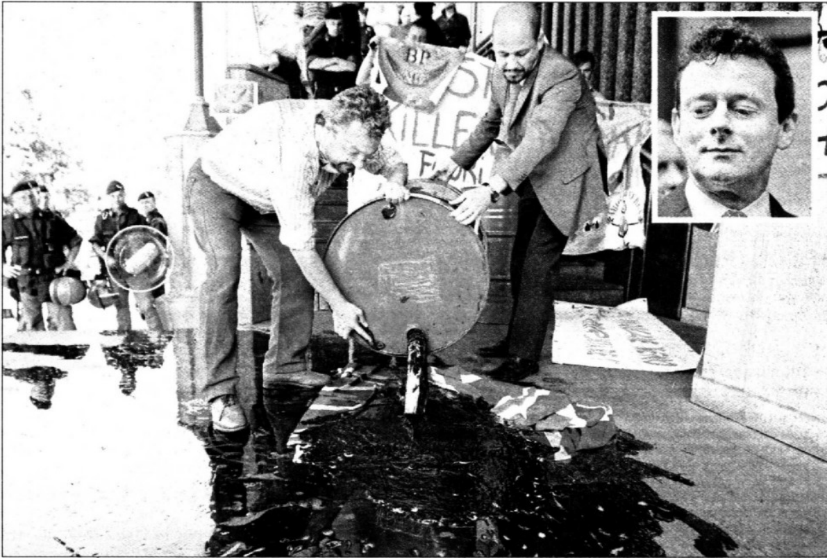
La salida del director ejecutivo de la petrolera (en el recuadro) ocurrirá el primero de octubre debido a las fuertes críticas a su labor para enfrentar la tragedia ecológica desatada por la explosión y hundimiento de la plataforma Deepwater Horizon , el 20 de abril. La empresa dijo que resiente pérdidas por casi 17 mil millones de dólares por los costos derivados de la lucha contra el derrame de crudo en el Golfo de México. En Milán, Italia, ambientalistas vaciaron tanques con líquidos semejantes a hidrocarburos en una gasolinera de la trasnacional