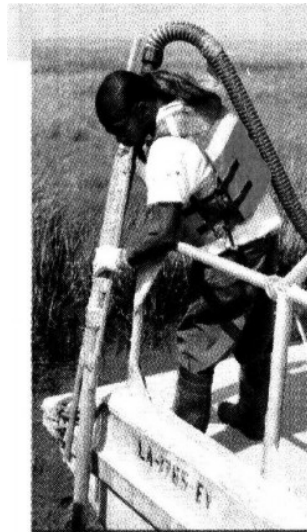
Un trabajador limpia petróleo de la cienaga en Barataria Bay, Louisiana.