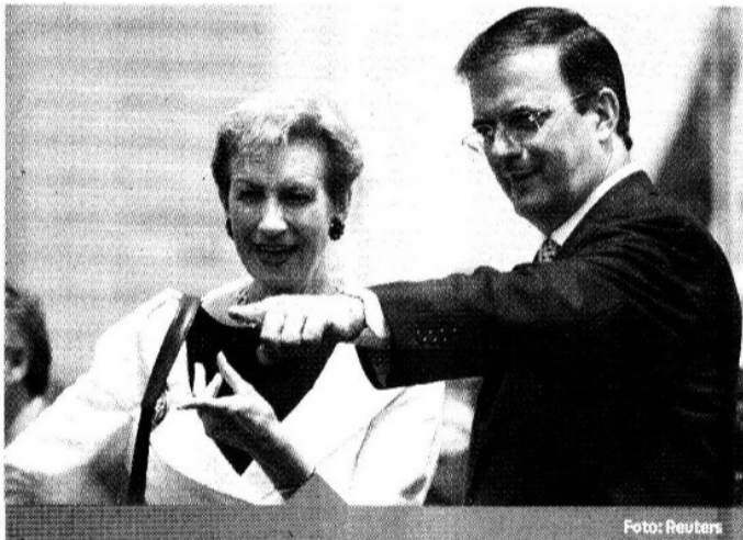
SON 475 METROS 2 DE JARDÍN