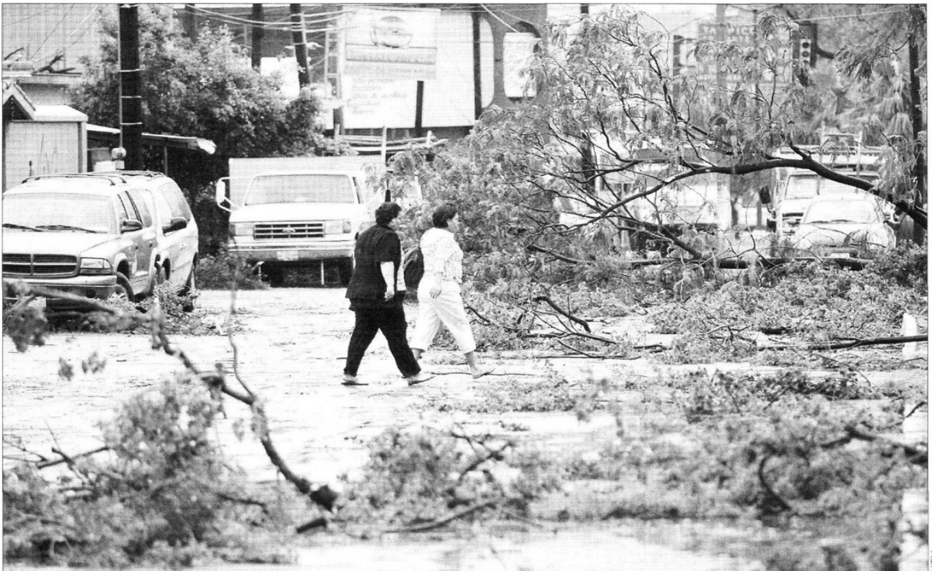
INTENSO. Los embates de Alex se han dejado sentir en Ciudad Victoria, Tamaulipas, donde hay zonas sin energía eléctrica, árboles y semáforos caídos por las fuertes rachas de viento.

El Consejo Estatal de Protección Civil anunció que durante la mañana de ayer Alex , ya convertido en tormenta tropical, se dirigía hacia San Luis Potosí.