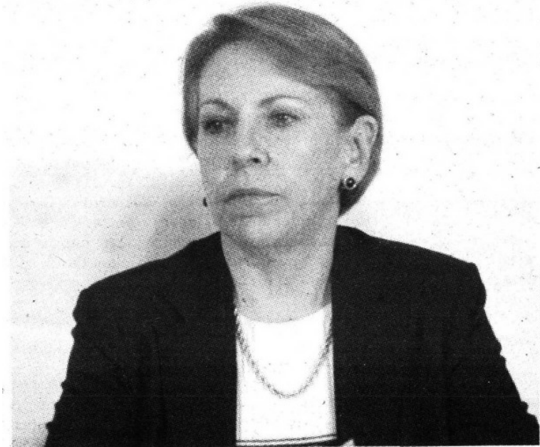
IMPACTO, EL DIARIO | ALEJANDRO VARGAS