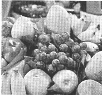
Canasta básica.