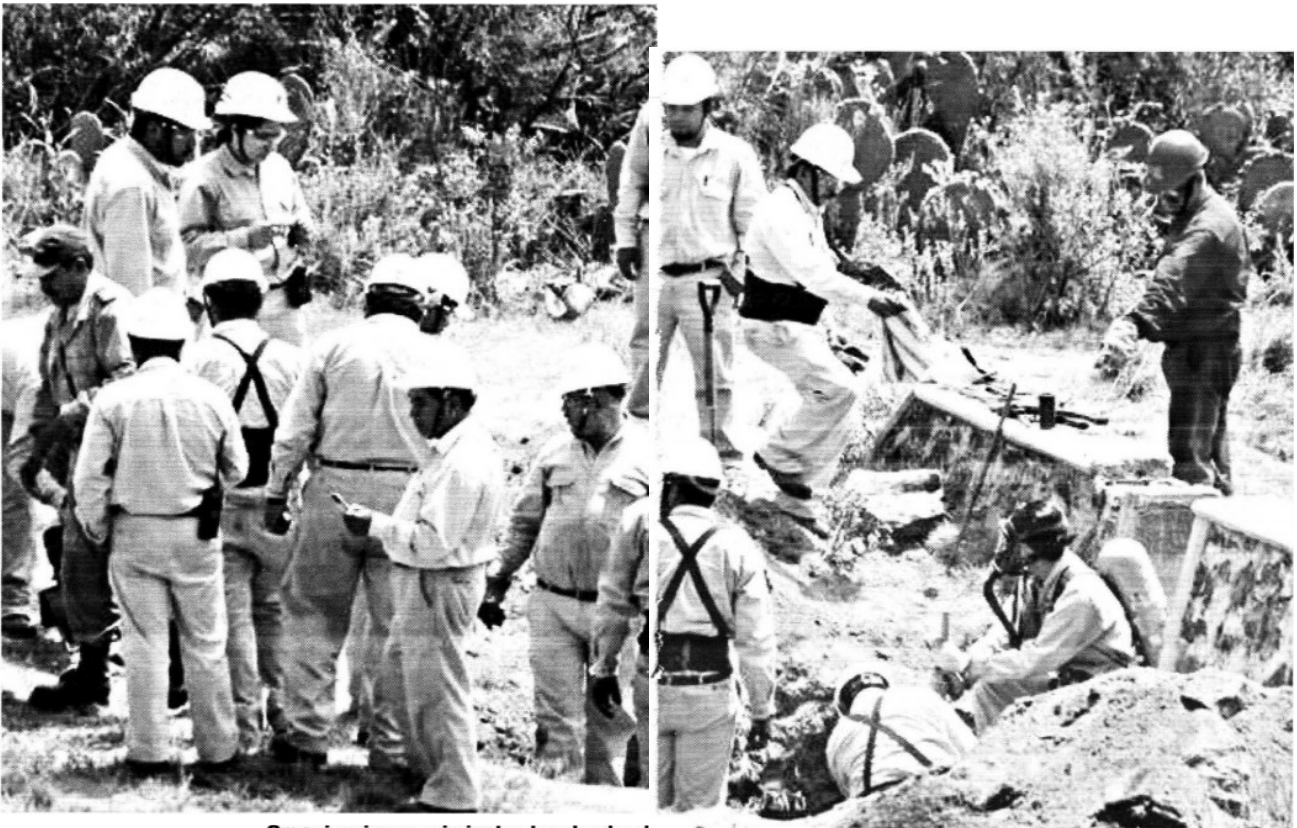
Organizaciones criminales han hecho d Batallas Mexicanas un millonario botín