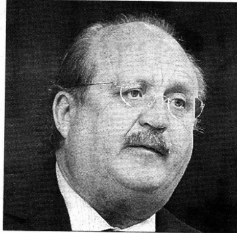
Francisco Labastida, PRI

Ⓞ (Si) El mercado de Estados Unidos está abierto, los resultados van a ser siempre complicados”.