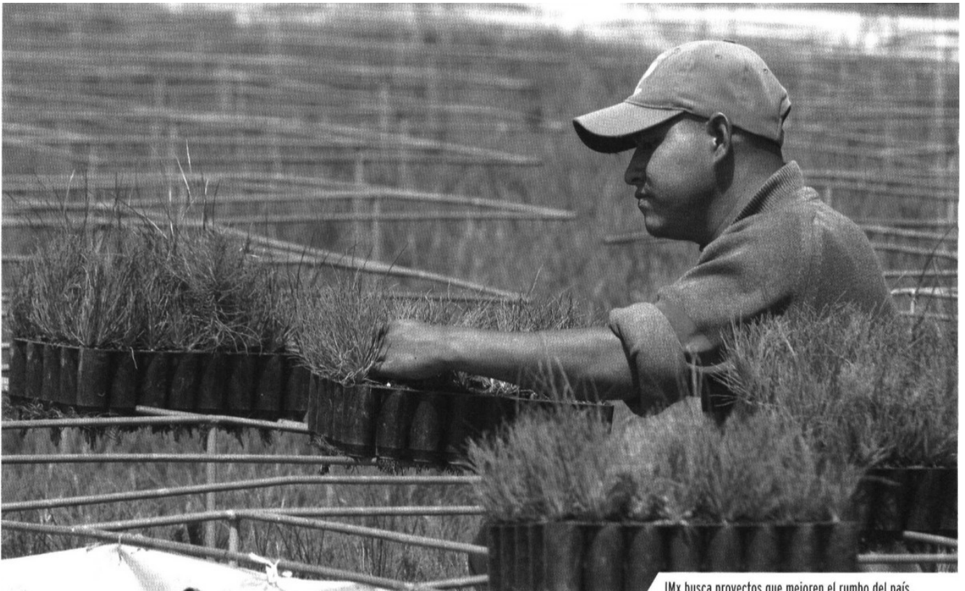
IMx busca proyectos que mejoren el rumbo del país.