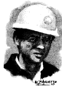
Tony Hayward.