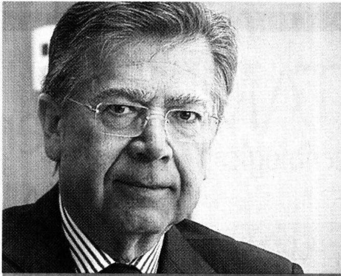
Héctor Rangel Domene, director general de Nafin-Bancomext.