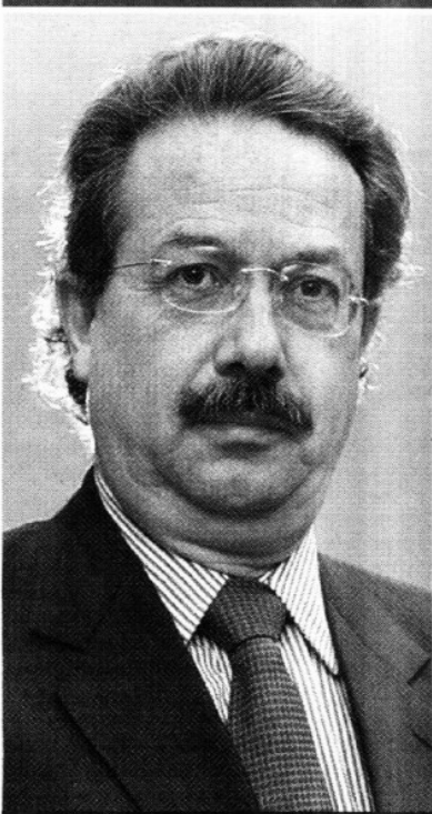
JUAN MOLINAR HORCASITAS TITULAR DE LA SCT