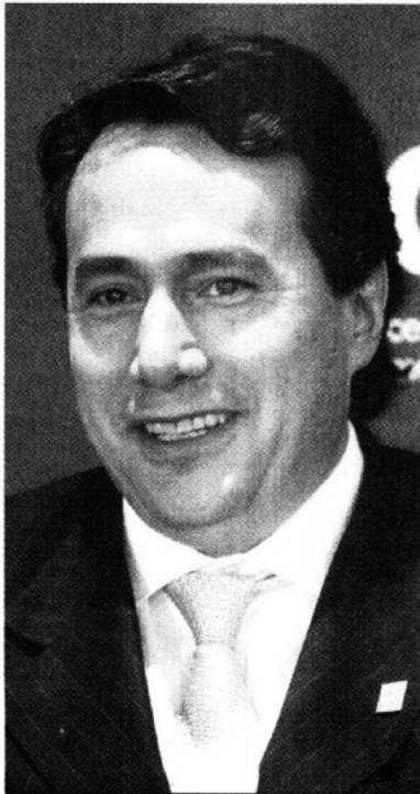
GERARDO RUIZ MATEOS SECRETARIO DE ECONOMÍA

de los 792 trámites y normas que opera, se comprometió a quitar