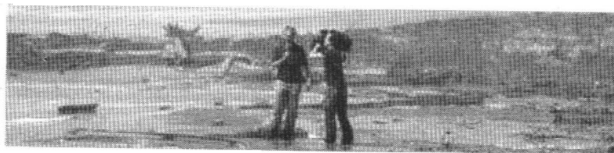
Un equipo de televisión trabaja en la playa de South Pass, Luisiana.

Ken Salazar sostuvo que podrían ser necesarios tres meses para lograr la solución definitiva