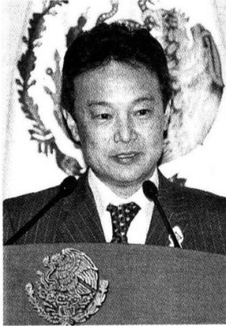
Koji Ishimatsu, presidente de Mitsui de México