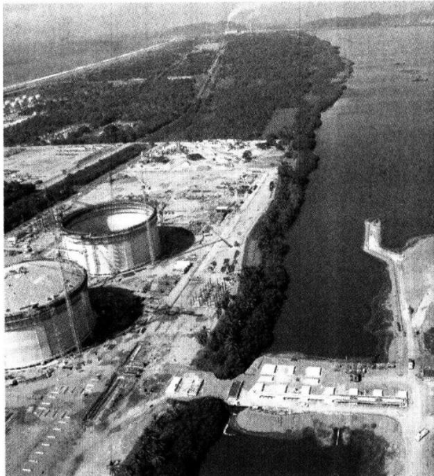
Planta de regasificación de gas licuado.