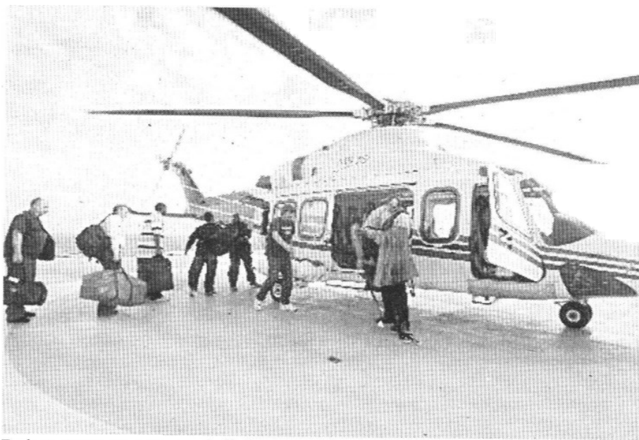
Trabajadores abordan un helicóptero en el Discover Deep Seas, buque de perforación de Chevron en el Campo Tahiti del Golfo de México.

Por su parte, Labastida Ochoa adelantó que el Senado "no firmará cheques en blanco", por lo que el futuro acuerdo deberá garantizar el aprovechamiento recíproco y compartido del crudo que pueda existir en la región marítima transfronteriza. ☒