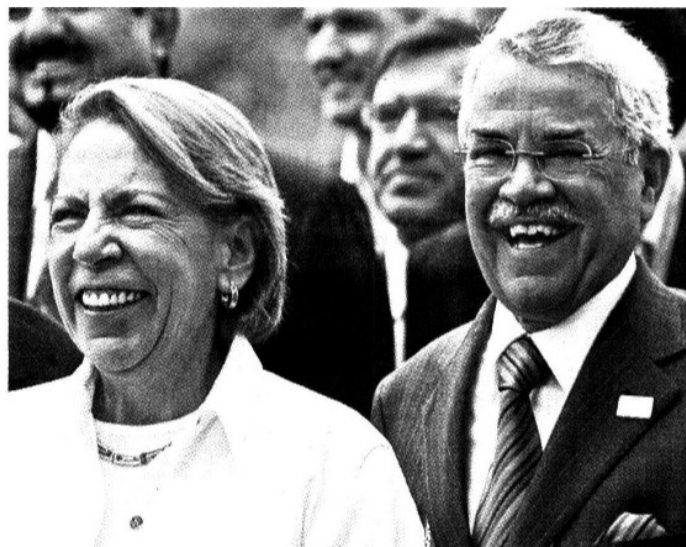
> Ali bin Ibrahim Al-Naimi, ministro de petróleo de Arabia Saudita y Georgina Kessel, titular de la Sener en el Foro de Energía.

Vence la moratoria que protege el Polígono Occidental, conocido como Hoyo de Dona.