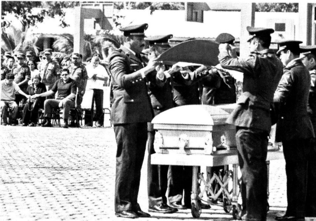
> El General Mauro Enrique Tello Quiñones fue acribillado por un comando el 3 de febrero en Quintana Roo.

Un total de 35 elementos del Ejército han sido acribillados este año en hechos relacionados con el crimen organizado, entre ellos dos generales: