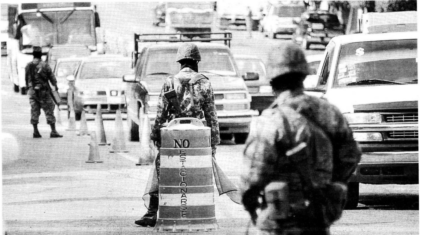
Patrullajes militares en Morelos tras la muerte de Arturo Beltrán Leyva, abatido el pasado 16 de diciembre