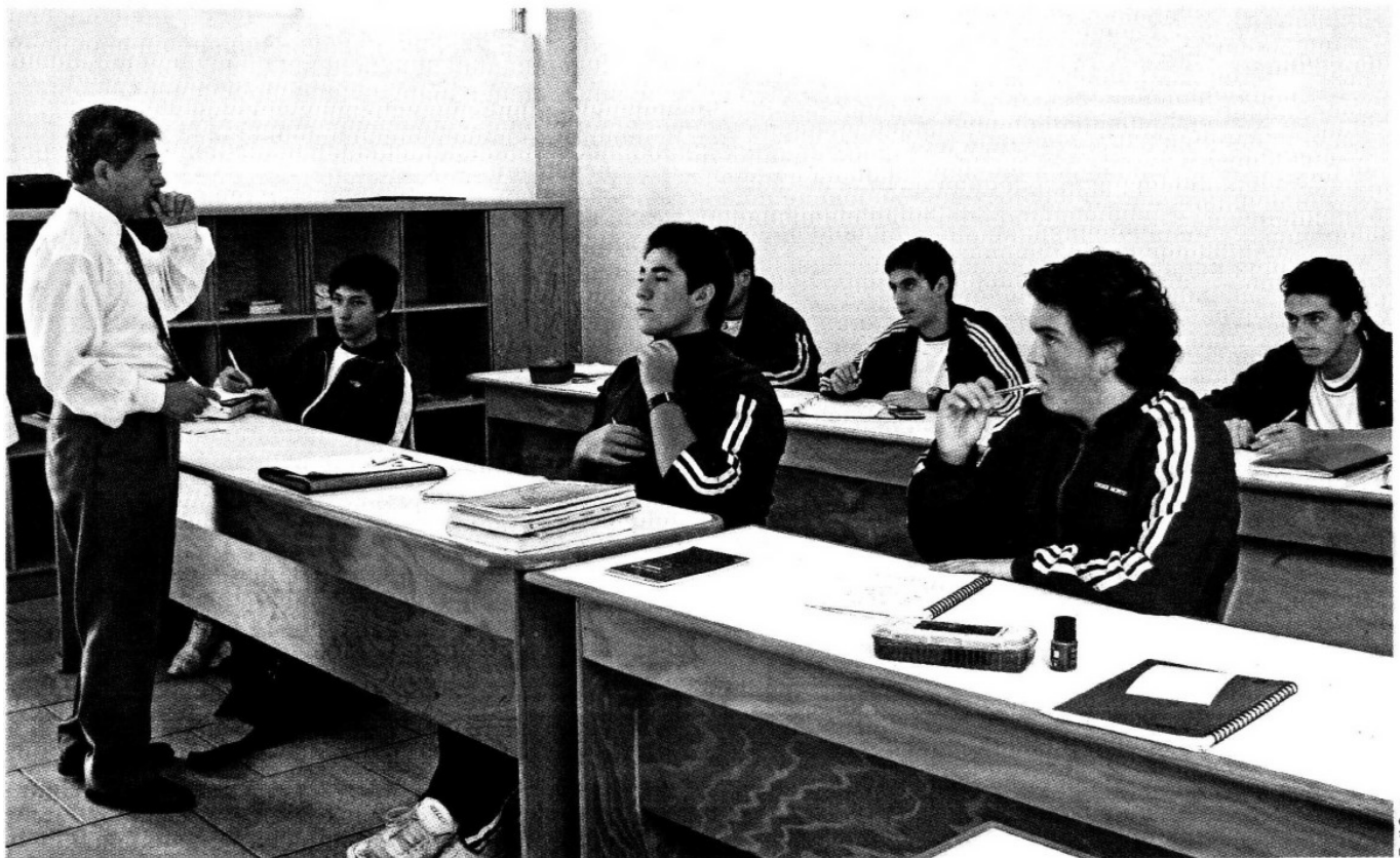
> Para la segunda aplicación de la prueba ENLACE, el Colegio Cedros buscó reforzar los conocimientos a partir de una estrategia integral.