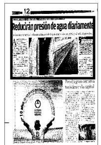
Las lluvias no han elevado el nivel de agua en las presas