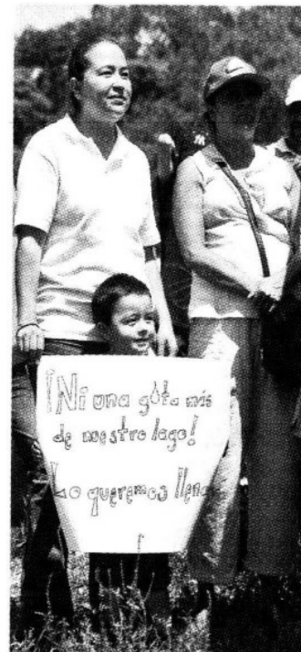
> Ciudadanos y locatarios acudieron a la manifestación para pedir solución.