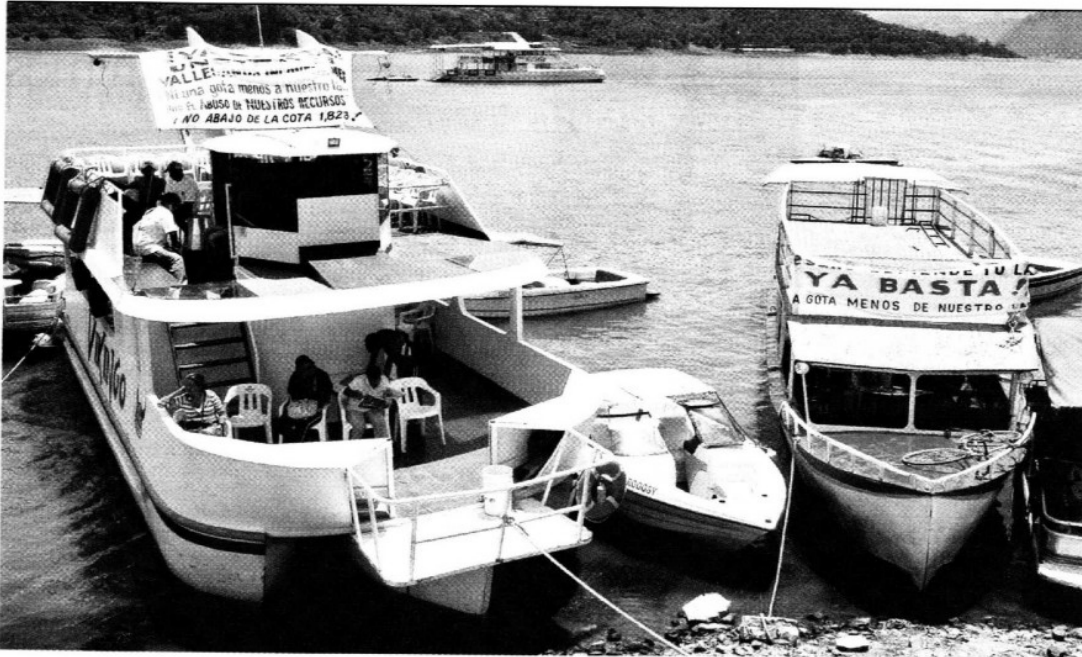
> Las embarcaciones de la zona también participaron portando mantas de protesta.