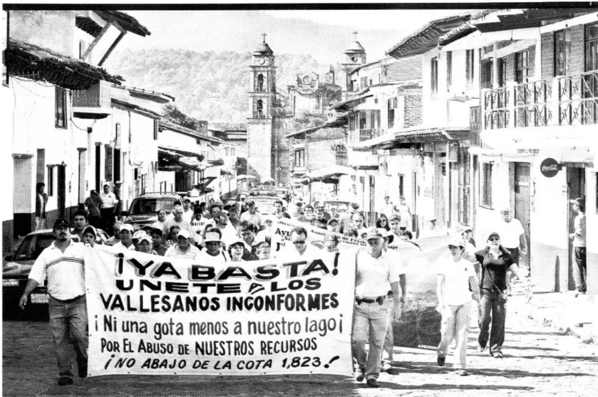
» Cerca de 300 personas marcharon por las inmediaciones del estanque vallesano y otras lo hicieron con lanchas y playeras con leyendas como 'Valle vale por su lago, sin su lago Valle vale'.

» Calcula Conagua que se necesitaría suspender dos meses el abastecimiento que dan al Sistema Cutzamala para recuperar 5 metros de la cota en la presa