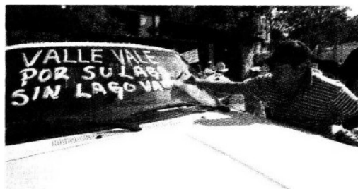
▶ Autos y lanchas portaban frases alusivas a la causa.