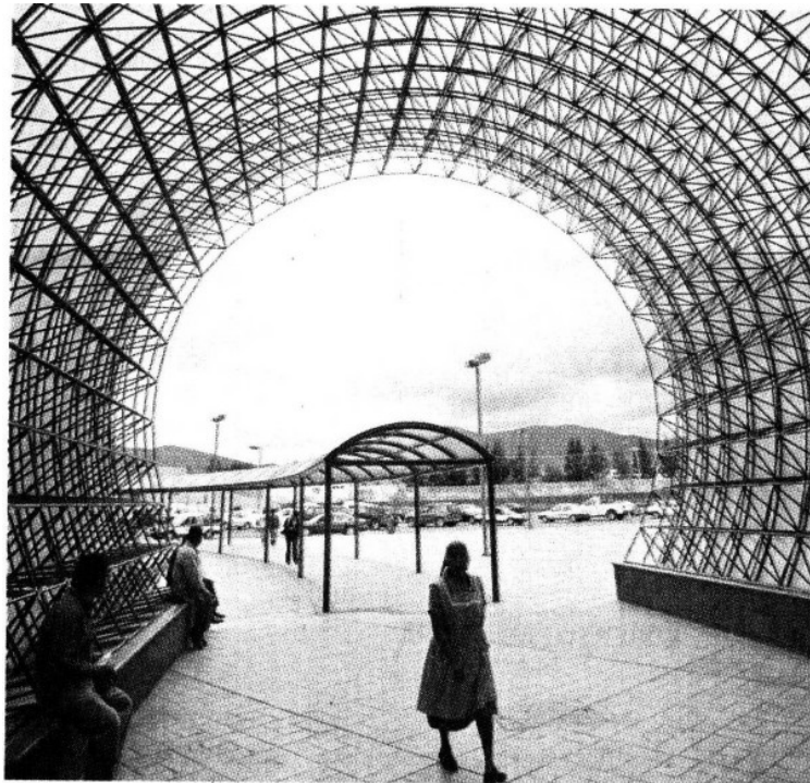
> En el Municipio de San Bartolo Coyotepec, se construyó el Hospital Regional de Alta Especialidad.