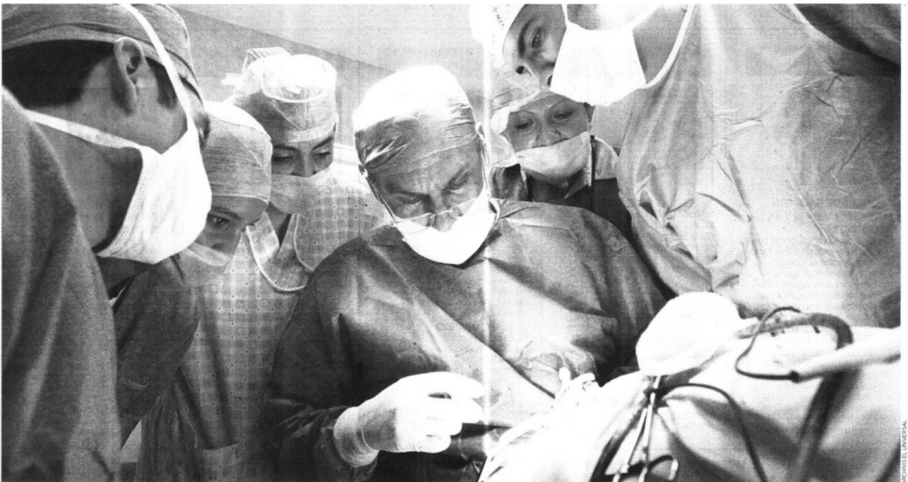
CONTRA INFECCIONES. Estos sistemas poliméricos pueden interactuar con antibióticos para evitar infecciones asociadas al uso de catéteres

Con radiación ionizante (rayos gama de cobalto 60 o electrones acelerados por un acelerador Van de Graaff) se forma una red a partir de una matriz polimérica o se injertan uno o varios monómeros inteligentes en un polímero. Cada matriz polimérica puede tener una arquitectura distinta: de injerto binario, de redes interpenetrantes (dos redes o geles entrecruzados sin que estén unidos químicamente), de redes semiinterpenetradas, de geles tipo peine, etcétera, así como propiedades diferentes: velocidad de respuesta más rápida o lenta, resistencia mecánica más fuerte o débil, eficiencia y reversibilidad variables, etcétera.