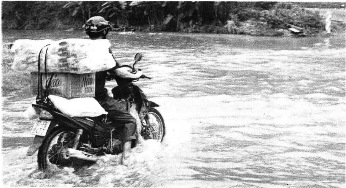
Un motociclista vadea una zona inundada por las lluvias en Bac Kan, Vietnam.