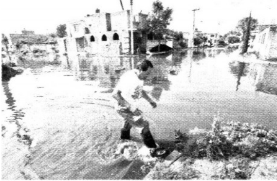
Las calles con inundaciones fueron Víctor Cordero, Cancionero, Guadalupe Trigo, Agustín Lara, Farolito y Juventino Rosas.