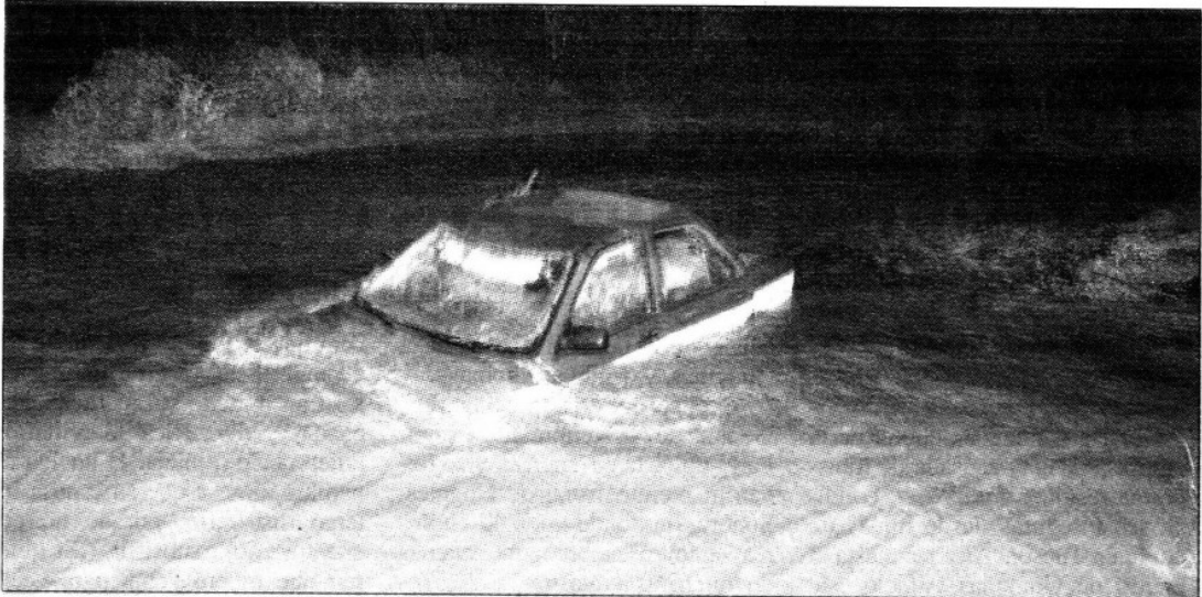
Un menor de edad desapareció en un río de San Pedro Ixtlahuaca, Oaxaca, cuando el taxi en el que viajaba junto con su madre fue arrastrado por las aguas