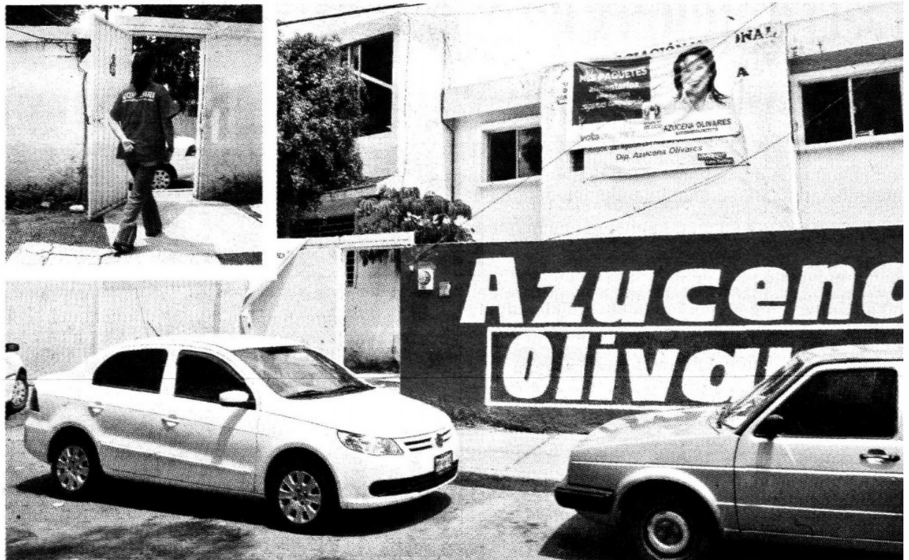
► La casa de campaña y sede de la asociación Amas de Casa, se encuentra en la calle Notemaérica 11 esquina Cali, en Las Américas.