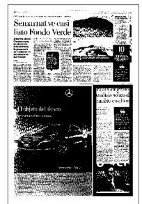
Elvira Quesada propone a los diputados considerar el cambio climático en el próximo presupuesto de egresos, que se discutirá próximamente.