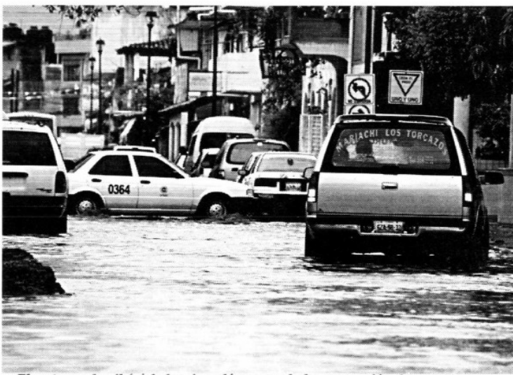
El meteoro derribó árboles, inundó casas y hubo evacuación de personas.