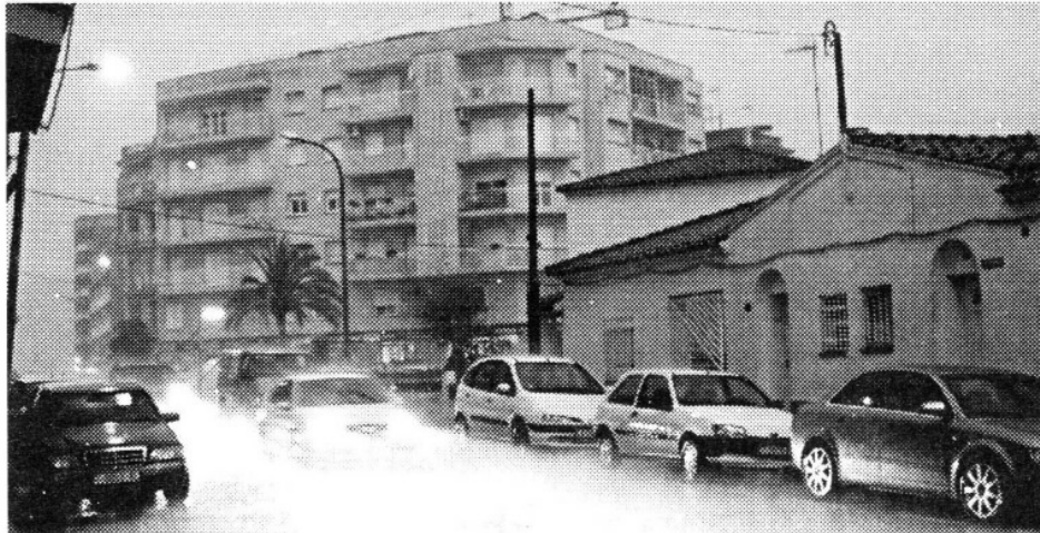
Se emitió alerta desde Zihuatanejo hasta Colima.