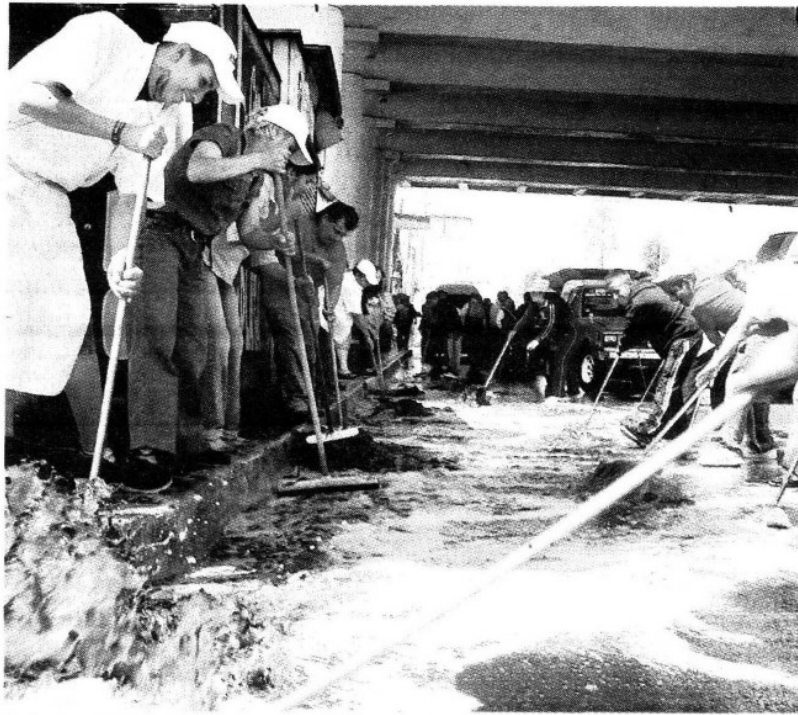
FÁTIMA SALVADOR EL GRÁFICO