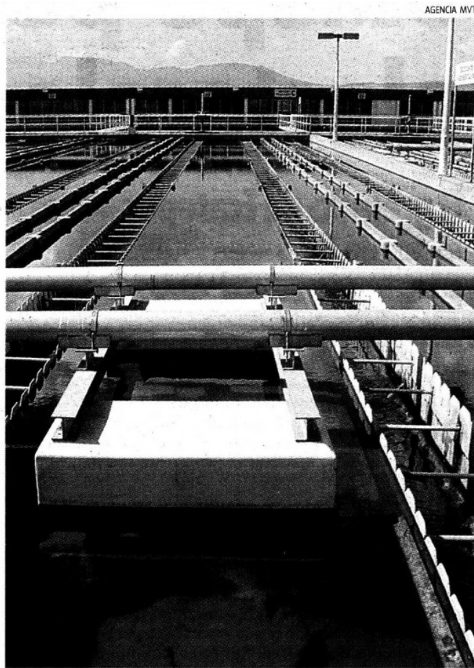
Las presas del Cutzamala están en su fase más crítica

◉ El dirigente señaló que han presentado dos denuncias más pero ha sido ante la FEPADE, y no ante la Fiscalía Especializada en Delitos Electorales de la Procuraduría General de Justicia del Estado de México, pues ésta “trae consigna y no actúa imparcialmente”.