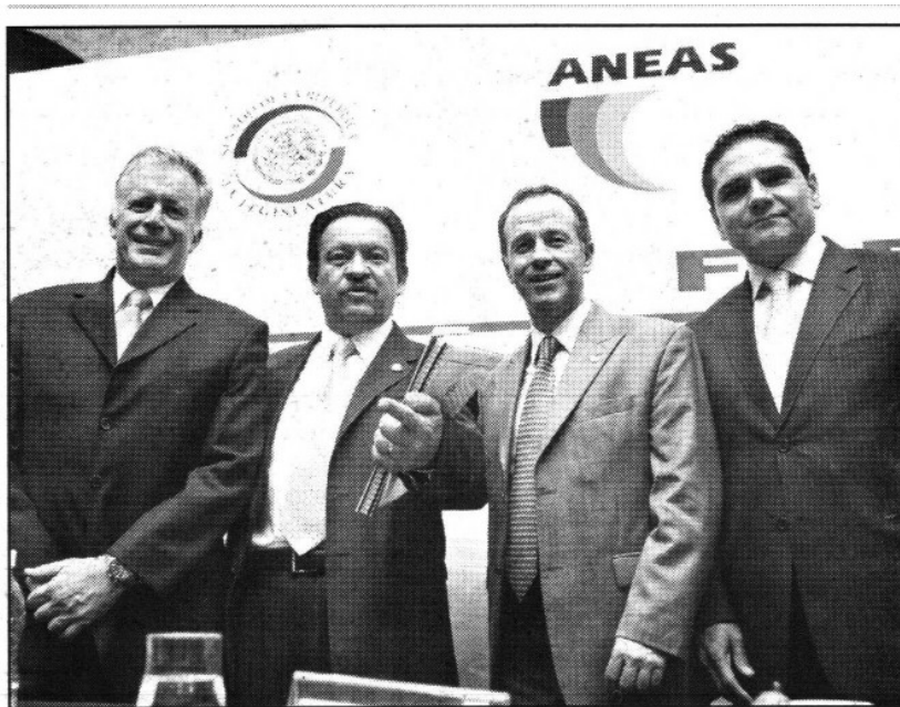
El titular de la Conagua se mostró preocupado por la falta de lluvia.