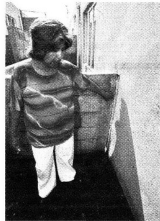
Decenas de casas resultaron con cuarteaduras en las paredes.

La mujer explicó que la casa de un nivel que compró mediante su crédito de Infonavit tuvo un costo de 270 mil pesos, y que quincenalmente abonaba a su préstamo 800 pesos.