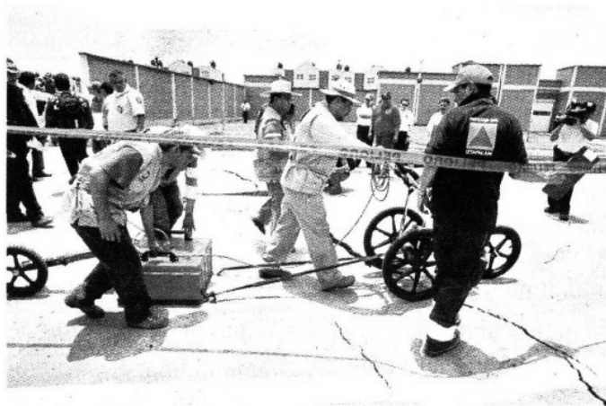
El equipo del Centro de Monitoreo de Grietas y Fracturamiento del Subsuelo de Iztapalapa apoyó en los estudios técnicos.

La grieta inició en un terreno a cielo abierto donde ARA construirá más casas.