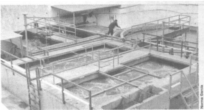
> El agua proviene de una de las 3 plantas de tratamiento de la zona.