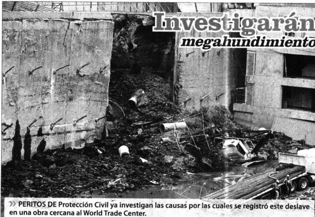
» PERITOS DE Protección Civil ya investigan las causas por las cuales se registró este deslave en una obra cercana al World Trade Center.