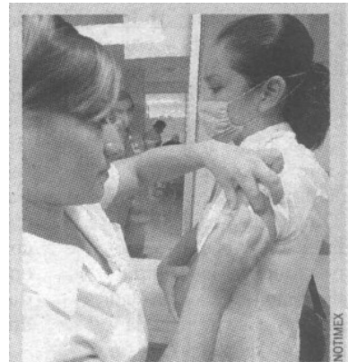
México es visto como un serio riesgo de provocar brotes de Influenza a nivel de comunidades