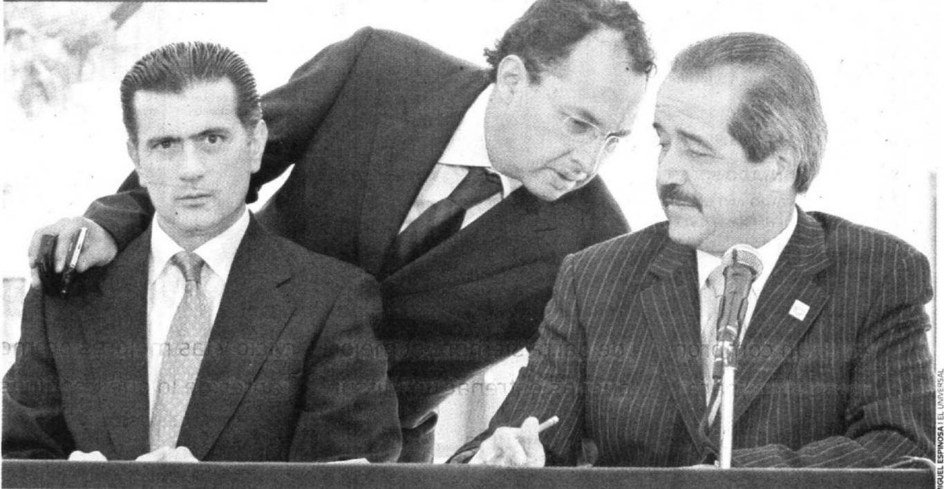
A PESAR de los reiterados llamados a la población para que usen tapaboca, los secretarios de Educación, Alonso Lujambio, y de Salud, José Ángel Córdova, así como el vocero presidencial Maximiliano Cortázar, no lo utilizaron a lo largo de las apariciones públicas que tuvieron ayer durante todo el día