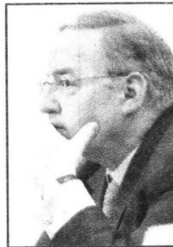
Jesús Reyes Heróles.

Osorio Chong confía en que la competencia permitirá llegar a acuerdos con los dueños de la tierra para comprarla