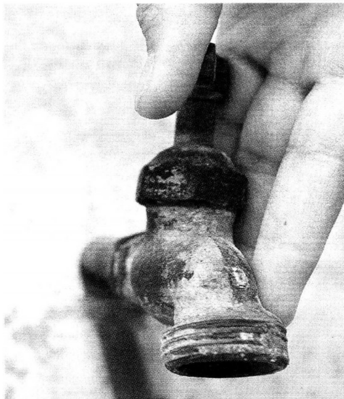
Los morosos son 20 por ciento de los usuarios del servicio