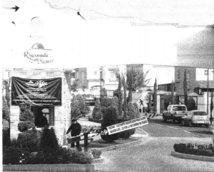
> La inmobiliaria incumplió con tres artículos de la Ley del Consumidor.