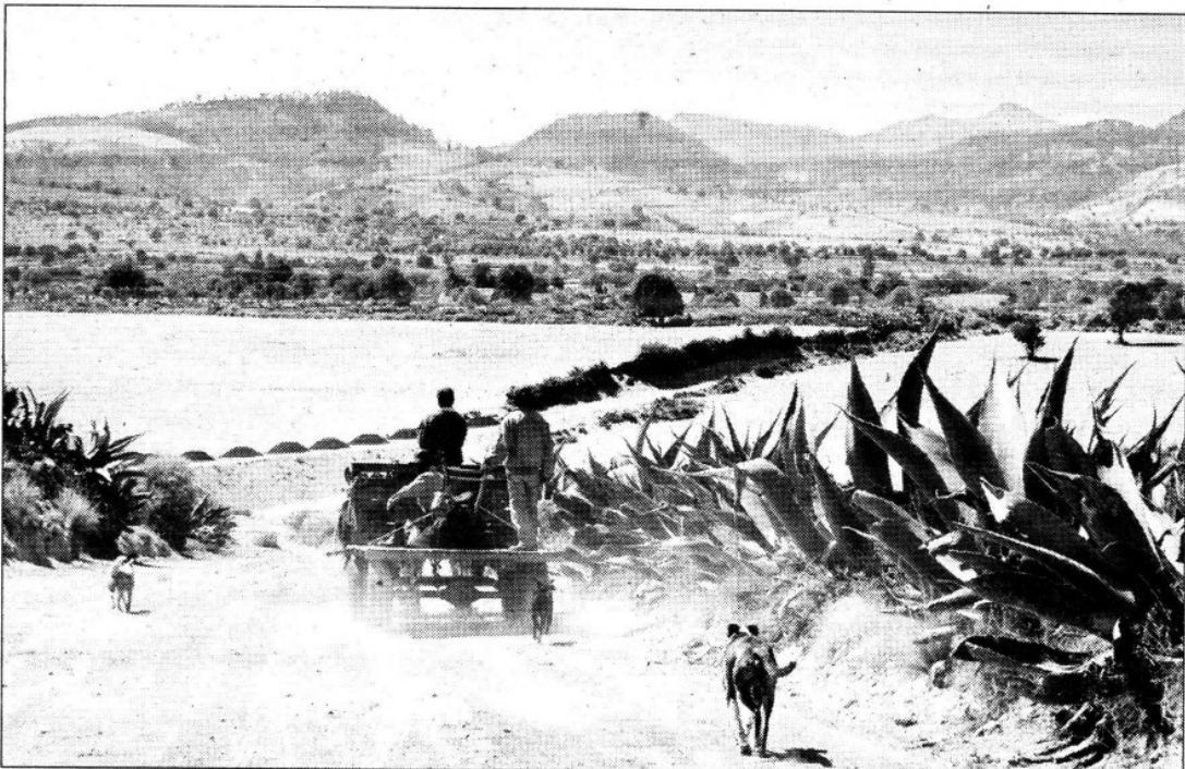
Aspecto del camino a la comunidad de La Gloria, del valle de Perote, Veracruz. Las autoridades de este poblado reconocieron que hay alerta epidemiológica, debido a la contaminación generada por las granjas porcícolas