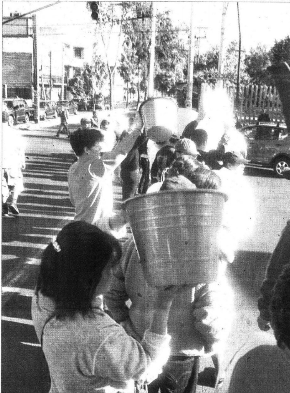
» TODAVÍA NO inicia la suspensión del abasto de agua cuando ya habitantes de Iztapalapa cierran calles para reclamar que se les dote del vital líquido.