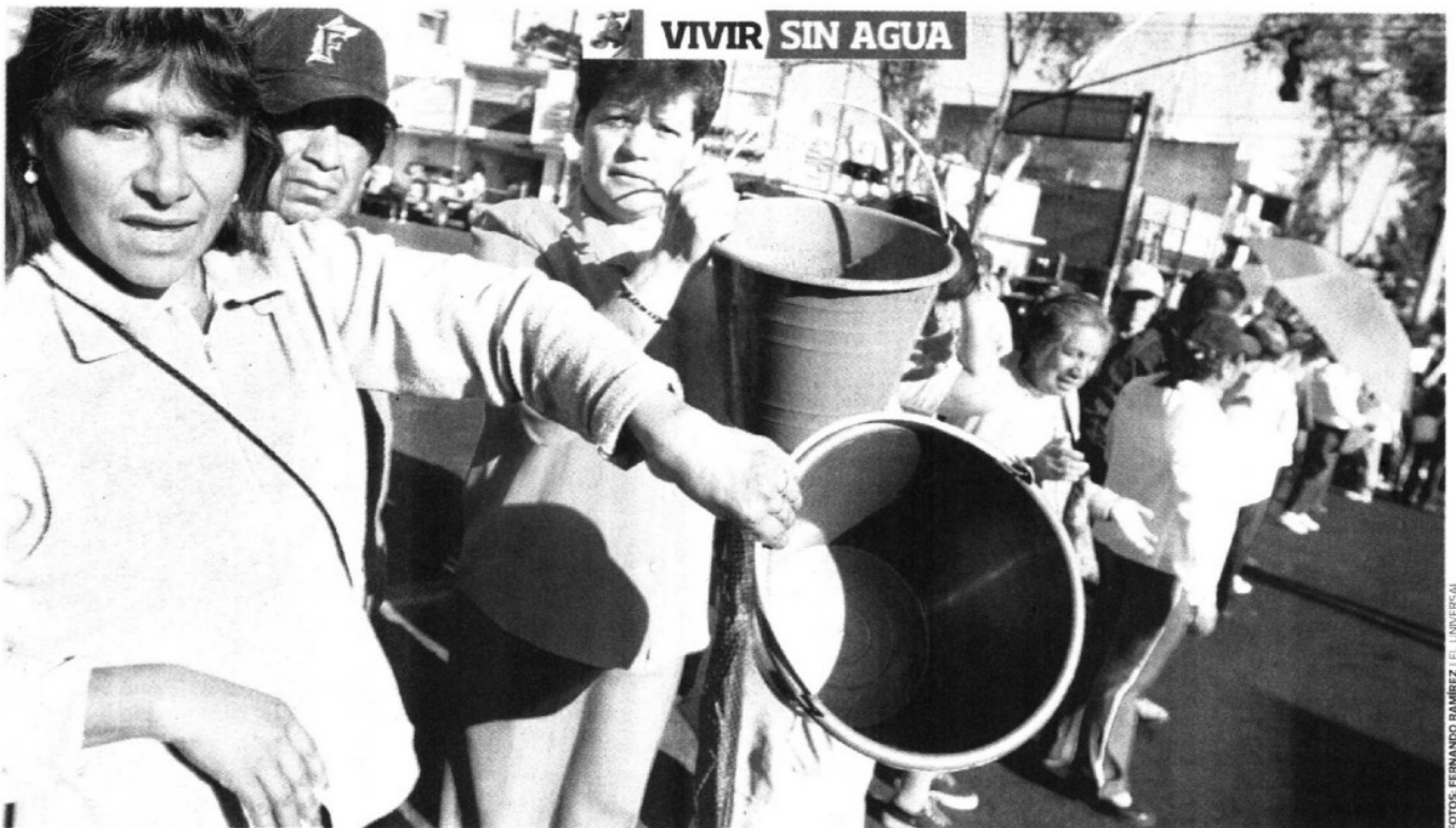
DEMANDA Habitantes de las colonias iztapatenses La Era, Francisco Villa y Palmitas bloquearon Ermita para exigir líquido en sus hogares