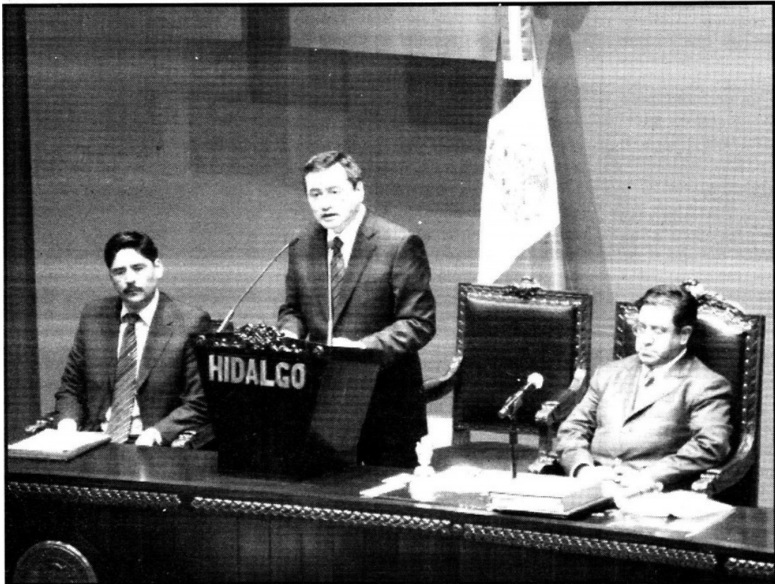
Pide gobernador no dejar que competencia política afecte lo construido.