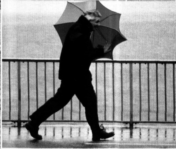
El Tercer Informe de la ONU sobre el Desarrollo de los Recursos Hídricos en el Mundo señala que una persona necesita entre 20 y 50 litros de agua al día