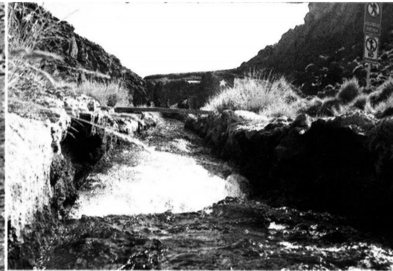
Únicamente nueve países estuvieron de acuerdo en declarar que el agua es un 'derecho humano'