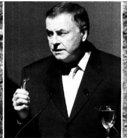
Loic Fauchon, presidente del Consejo Mundial del Agua, durante su participación en el foro

La declaración final del foro redactó que el agua sólo es una 'necesidad básica' y no un 'derecho humano'