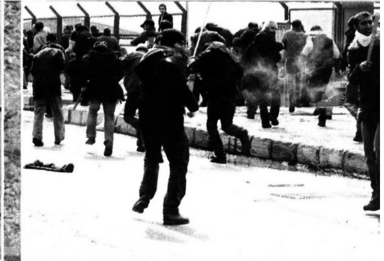
Un grupo de manifestantes se enfrenta a la policía durante la apertura del V Foro Mundial del Agua